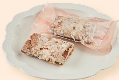
サブレ・チョコ味