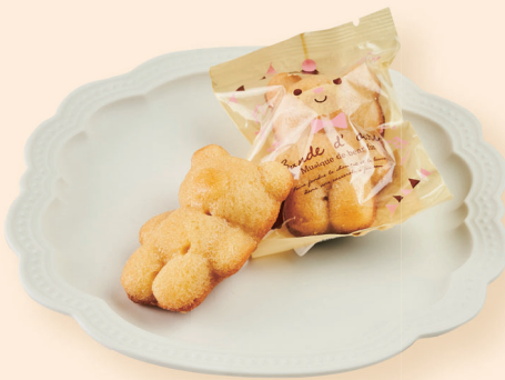
みつばちマドレーヌ