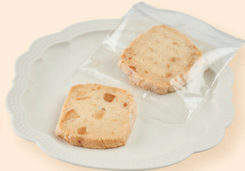
マカデミアサブレ