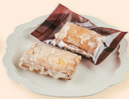
サブレ・バニラ味