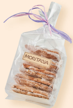
サブレ・バニラ味(5枚入)