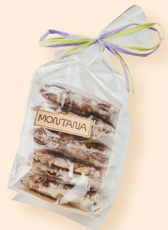
サブレ・チョコ味(5枚入)