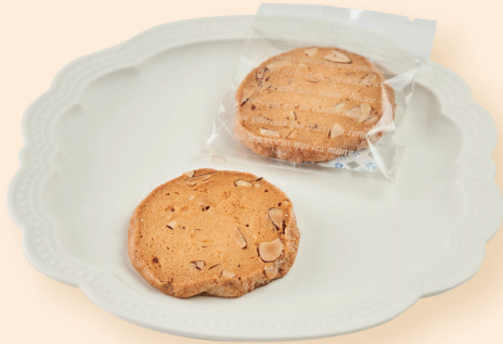
プレーンアマンド