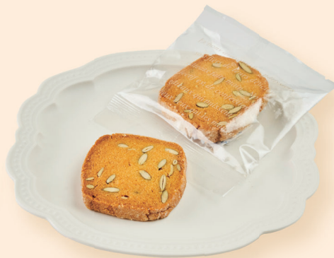
かぼちゃクッキー