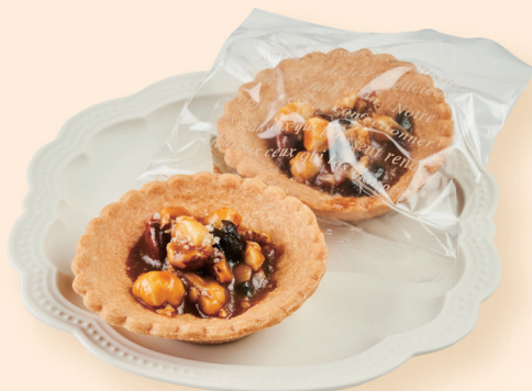
キャラメルナッツ