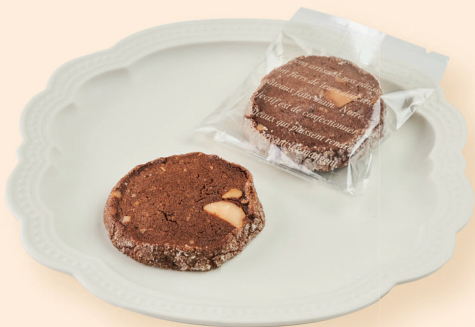
ショコラマカデミア