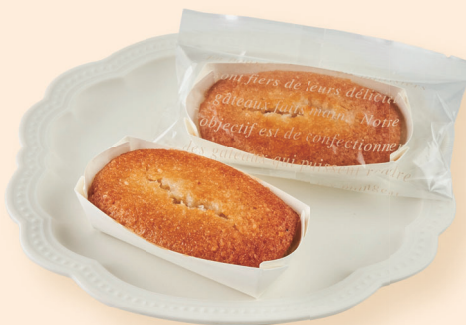
ココフィナンシェ