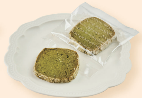
まっちゃクッキー