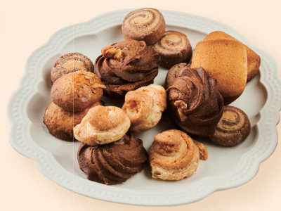
プチクッキー袋詰め